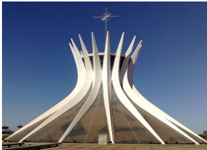
Cathédrale métropolitaine, Brasilia, Oscar Niemeyer, 1970