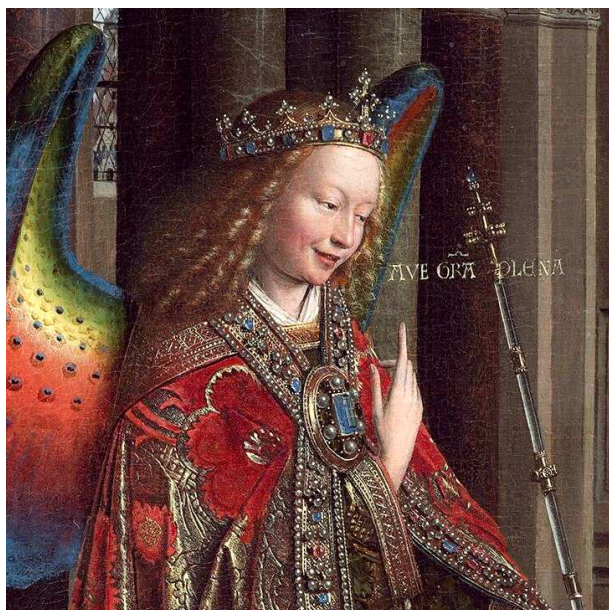
Jan van Eyck, L'Annonciation , vers 1434-1436, détail de l'archange Gabriel

Jeudi 1 er octobre 2020 à 18h Accueil à partir de 17h30