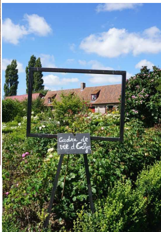
Senteurs parc Volckerinckhove