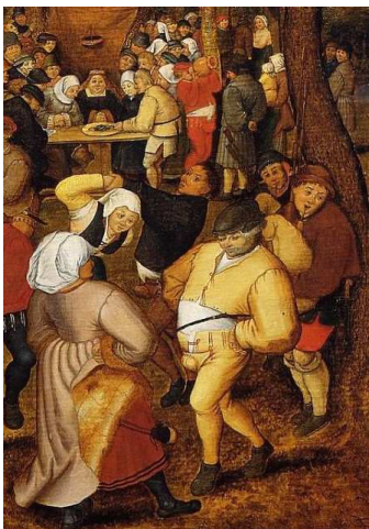
Pieter Brueghel le Jeune, Une noce de village , 1623, détail